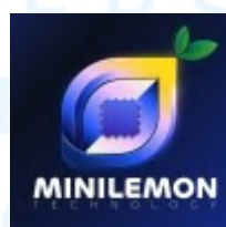
Gambar 2.3 Logo Minilemon Technology