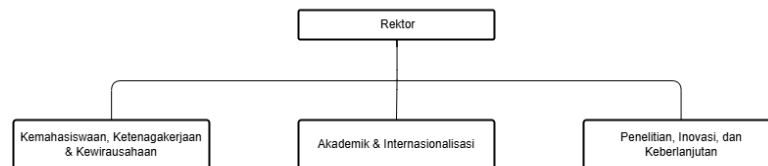
Gambar 2.2 Bagan Struktur Organisasi Rektorat Universitas Multimedia Nusantara

Anggota Rektorat UMN tentunya dikepalai oleh seorang Rektor dan dibawahhi oleh perwakilan di bidang Kemahasiswaan, bidang Employability & Kewirausahaan, Akademik & Internasionalisasi, serta bidang Penelitian, Inovasi, dan Keberlanjutan.