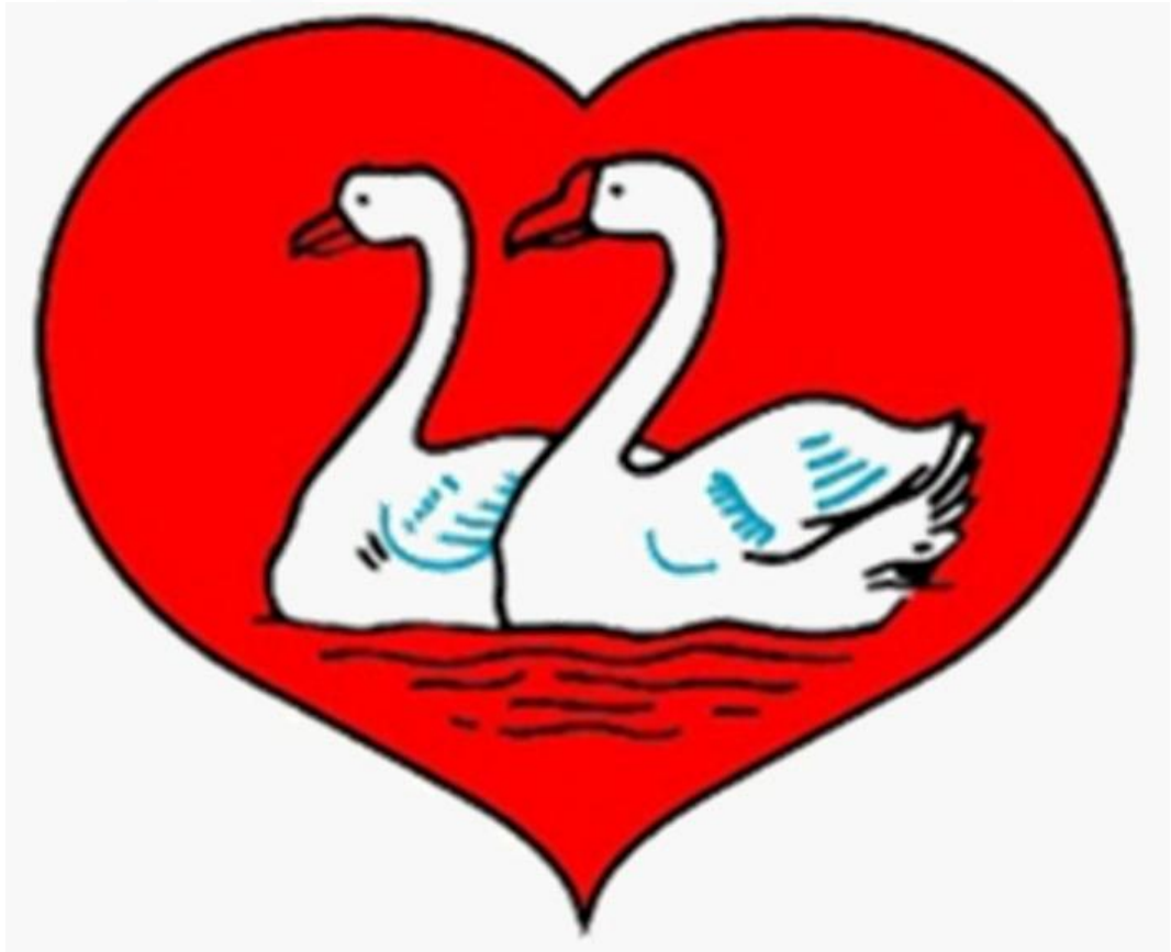
Gambar 2. 1 Logo PT Kilang Kecap Angsa

PT Kilang Kecap Angsa merupakan perseroan terbatas swasta nasional yang memproduksi dan mendistribusikan berbagai macam produk kecap miliknya. PT Kilang Kecap Angsa didirikan di kota Medan dan didirikan pada tahun 1955 oleh Eghin yang merupakan seorang WNI berketurunan Tionghoa. Pada saat itu Eghin mendirikan PT Kilang Kecap Angsa menggunakan modal sendiri dan belum berbentuk Perseroan Terbatas (PT), melainkan perusahaan tersebut masih dalam bentuk Kilang Kecap. Dengan nama Kilang Kecap Angsa, perusahaan tersebut hanya memiliki beberapa karyawan yang bekerja pada perusahaan tersebut.