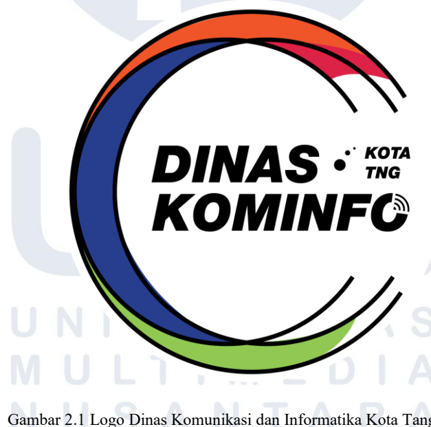
Gambar 2.1 Logo Dinas Komunikasi dan Informatika Kota Tangerang [8]

Dinas Komunikasi dan Informatika Kota Tangerang adalah salah satu instansi pemerintah daerah. Dinas ini dibentuk berdasarkan Peraturan Daerah Nomor 8 Tahun 2019. Lokasi kantor berada di Pusat Pemerintahan Kota Tangerang, tepatnya di Jl. Satria Sudirman No. 1, Kota Tangerang. Dinas Komunikasi dan Informatika bertugas untuk menyebarkan informasi kebijakan pemerintah kepada masyarakat, mengembangkan sistem pemerintahan berbasis digital ( e-Government ), serta menjaga keamanan data dan komunikasi di lingkungan pemerintah Kota Tangerang. Dinas ini juga berperan dalam mengelola data dan statistik yang digunakan untuk mendukung pengambilan keputusan.