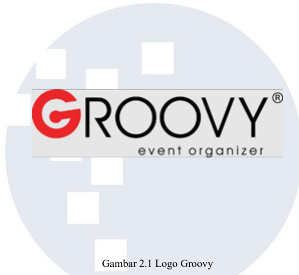
Gambar 2.1 Logo Groovy

Groovy Event Organizer merupakan perusahaan yang berfokus pada penyelenggaraan berbagai jenis acara dan mulai beroperasi pada tahun 2007. Perusahaan ini awalnya muncul dari layanan kecil yang menawarkan penyediaan kebutuhan acara ulang tahun ke-17, yang pada saat itu cukup populer dan banyak diminati. Peningkatan permintaan dari pasar membuat Groovy mendapatkan kepercayaan untuk menangani lebih banyak jenis acara, mulai dari skala kecil hingga menengah.