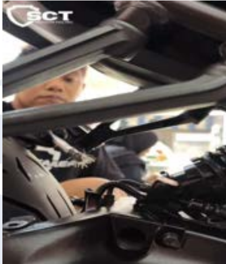
Gambar 2.6 Full Detailing Treatment

bersih, mengkilap, dan bebas dari noda kusam memakai obat khusus dari SCT Indonesia.