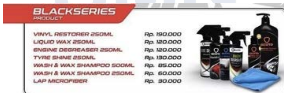
Gambar 2.9 Black Series

Produk ini merupakan alat bantu utama dalam proses pembersihan, pengeringan, dan pengaplikasian cairan detailing . Terbuat dari serat halus berukuran mikron, lap ini mampu menyerap air dan kotoran tanpa meninggalkan goresan pada permukaan cat. Produk Black Series wajib diaplikasikan menggunakan lap microfiber.