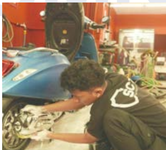
Gambar 2.8 Premium Wash

SCT Indonesia juga menyediakan layanan premium wash , yakni layanan cuci motor premium. Keunggulan premium wash SCT Indonesia yaitu menggunakan sabun pH-balanced dan microfiber premium , serta pengaplikasian Liquid Wax di body motor dan pemolesan bagian ban.