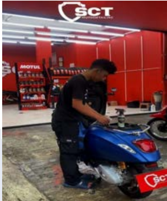
Gambar 2.7 Engine Area Cleaning & Protection