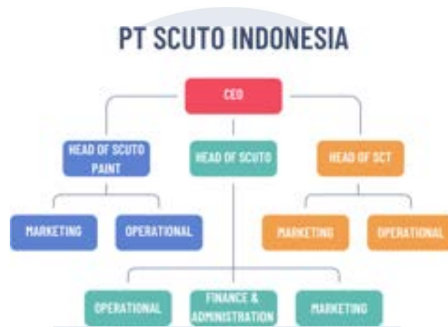
Gambar 2.3 Struktur Perusahaan

Secara garis besar, struktur organisasi SCT Indonesia berada di bawah kepemimpinan Chief Executive Officer (CEO) PT Scuto Indonesia, dengan pelaksanaan operasional sehari-hari yang dikoordinasikan oleh Head of SCT Division .