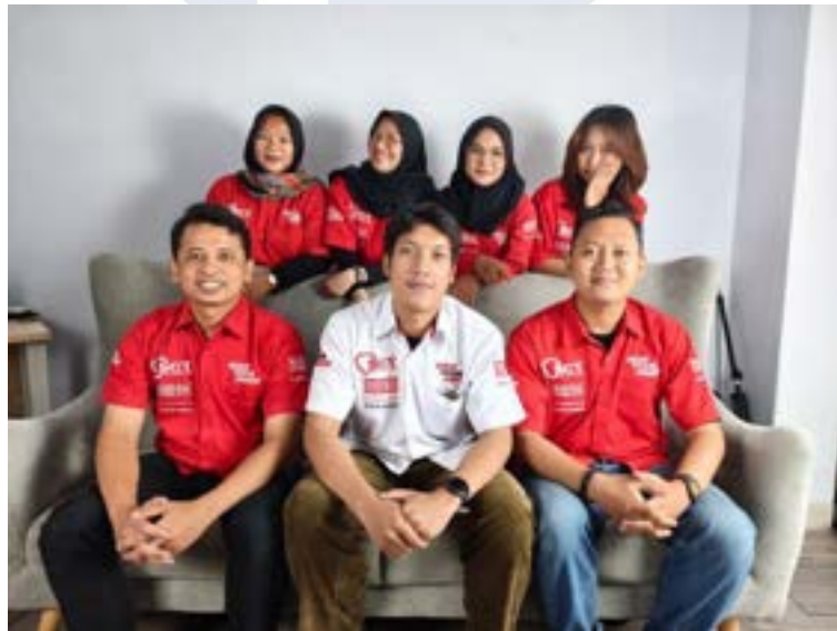
Gambar 2.4 Marketing Division

Divisi ini bertugas untuk merancang dan melaksanakan strategi pemasaran perusahaan, terutama di media digital seperti Instagram dan TikTok. Tanggung jawabnya meliputi pembuatan konten promosi, pengelolaan media sosial, perencanaan kampanye digital, serta analisis performa konten. Divisi ini mencakup Content Creator , Digital Marketing , dan Graphic Design .