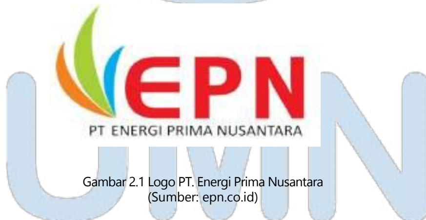
Gambar 2.1 Logo PT. Energi Prima Nusantara

Perusahaan mempunyai visi yaitu menjadi perusahaan yang unggul, tumbuh berkembang, dan di percaya oleh stakeholder serta bersahabat dengan lingkungan. Kemudian PT. Energi Prima Nusantara juga mempunyai misi yaitu menjalankan usaha dalam bidang pengelolaan limbah pertambangan dan energi, jasa dan angkutan serta perdagangan umum berdasarkan kaidah bisnis yang sehat guna menjamin keberadaan dan pengembangan perusahaan yang berkelanjutan.