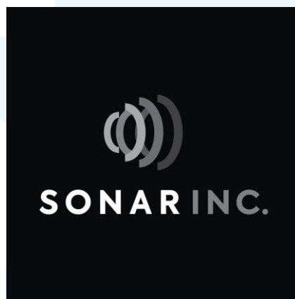
Gambar 2. 1. Logo Sonar Inc.

Sonar Inc (CV Sonar Ciptamas Kreasindo) merupakan perusahaan spesialis audio post-production yang resmi berdiri sejak tahun 2017. Pendirian perusahaan ini diinisiasi oleh dua orang pendiri yang dipertemukan dalam sebuah proyek kolaboratif, di mana keduanya memiliki visi dan ketertarikan yang sama terhadap dunia pascaproduksi audio.