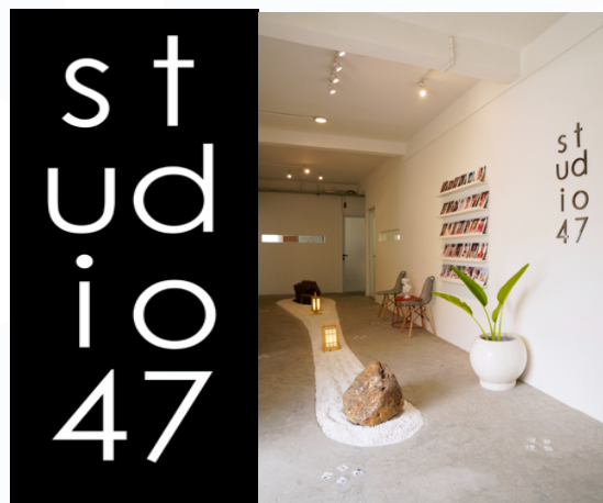
Gambar 2.1 Logo PT Studio Empat Tujuh

PT Studio Empat Tujuh merupakan perusahaan yang bergerak di bidang industri kreatif dengan fokus pada fotografi, videografi, creative direction, styling, beauty, dan fashion. Perusahaan ini didirikan dengan visi untuk menjadi salah satu pelaku utama dalam industri kreatif Indonesia dengan mengedepankan profesionalisme dan kualitas dalam setiap karya yang dihasilkan. Sejak awal berdirinya, PT Studio Empat Tujuh membangun tim yang terdiri dari agen dan produser profesional yang tidak hanya berperan dalam merepresentasikan talenta, tetapi juga membina dan mengembangkan potensi terbaik di bidang seni visual.