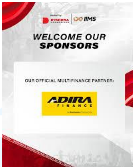
Gambar 2.5 Kerja Sama PT Adira Finance dengan IIMS

Pada gambar 2.5 Kerja Sama PT Adira Finance dengan IIMS, Adira Finance berperan sebagai mitra pembiayaan resmi yang mendukung peningkatan penjualan partner sekaligus memperluas eksposur merek perusahaan.