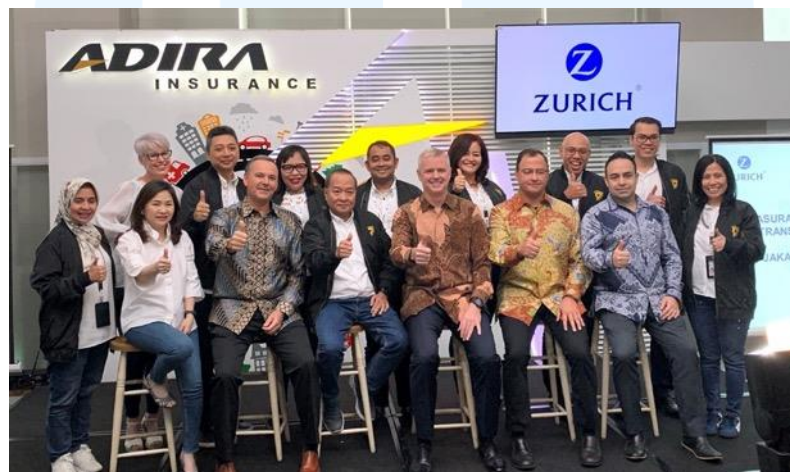
Gambar 2.4 Kerja Sama PT Adira Finance dengan Zurich Insurance

Dalam rangka memberikan perlindungan menyeluruh kepada konsumen, Adira Finance bekerja sama dengan perusahaan asuransi seperti Zurich.