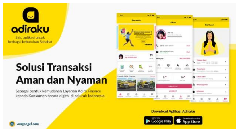
Gambar 2.6 Kerja Sama PT Adira Finance Adiraku

Dalam mendukung transformasi digital , Adira Finance mengembangkan dan bekerja sama melalui berbagai platform digital seperti Adiraku, momobil.id, momotor.id, moservice.id, dan dicicilaja.com.