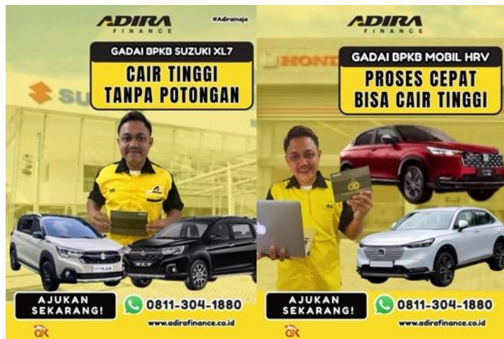
Gambar 2.2 Kerja Sama PT Adira Finance dengan Dealer Mobil

Pada gambar 2.2 Kerja Sama PT Adira Finance dengan Dealer Mobil, Adira Finance menyediakan solusi pembiayaan kendaraan baru maupun bekas yang disesuaikan dengan kebutuhan konsumen di berbagai wilayah Indonesia. Jaringan kerja sama ini didukung oleh lebih dari 530 jaringan bisnis yang tersebar secara nasional dan melayani lebih dari 2 juta konsumen aktif.