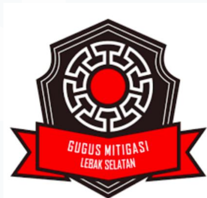
Gambar 2. 1 Logo Gugus Mitigasi Lebak Selatan

Strategi GMLS dalam mewujudkan visi resiliensi bencana dituangkan ke dalam dua program jangka panjang yang strategis. Program pertama adalah Tsunami Ready , yang telah dilaksanakan pada periode 2021 hingga 2022 dengan fokus pemenuhan standar keselamatan internasional IOC-UNESCO. Setelah keberhasilan fase tersebut, GMLS kini melanjutkan misinya melalui program Community Resilience yang ditargetkan berjalan hingga tahun 2028. Program keberlanjutan ini menitikberatkan pada penguatan ketahanan masyarakat dalam menghadapi dampak pascabencana, yang mencakup penguatan pada lima sektor vital: infrastruktur fisik, stabilitas ekonomi, kapasitas kelembagaan, kelestarian lingkungan alam, dan kohesi sosial (Gugus Mitigasi Lebak Selatan, 2023).