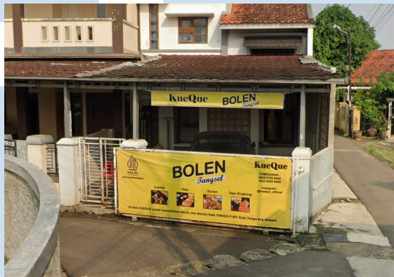
Gambar 2.2 UMKM KueQue

Muncul mengembangkan usahanya (Tangselpos, 2022). Selain itu, terdapat banyak acara di Tangerang Selatan yang mengundang UMKM untuk mempromosikan produknya, seperti Tangsel Digifest, Tangsel Sejiwa Fest, Festival UMKM Sinar Mas Land, dan sebagainya. Hal ini menunjukkan masih banyak masyarakat Desa Muncul yang memiliki usaha untuk mengembangkan perekonomian desanya melalui membangun UMKM untuk menjual berbagai produk dan jasa serta meningkatkan kesadaran masyarakat akan UMKM yang dibangun.