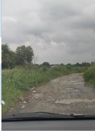
Gambar 2.2 Akses utama lokasi Griya Asri Pamulang

Tangerang Selatan, 2026). Lokasi yang akan menjadi fokus utama pada perancangan ini adalah lokasi UMKM Dbumbu di Griya Asri Pamulang.