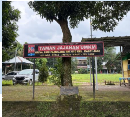
Gambar 2.4 Foto Taman Jajanan UMKM

& Sito (2026) mengatakan bahwa meskipun terdapat keterbatasan akses pada pemukiman Griya Asri Pamulang, terdapat beberapa penduduk yang memperoleh pendapatan sebagai bekerja kantoran, supir transportasi online , hingga menjalankan UMKM secara offline dan online . Selain itu, pemukiman Griya Asri Pamulang juga memiliki lahan taman jajanan UMKM yang telah di sah kan oleh pemerintahan.