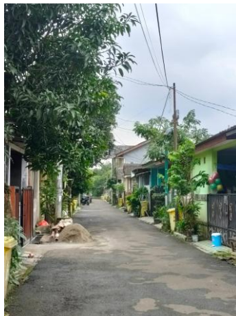
Gambar 2.3 Foto Dokumentasi Kunjungan ke Griya Asri Pamulang

Kunjungan ke lokasi dilakukan pada 9 Februari 2026. Berdasarkan hasil observasi, penulis dan tim tidak menemukan identitas penunjuk arah pada jalan utama sebelum memasuki akses menuju lokasi. Selain itu, posisi lokasi yang tertutup oleh semak-semak tinggi membuat keberadaan desa sulit dikenali oleh masyarakat sekitar.