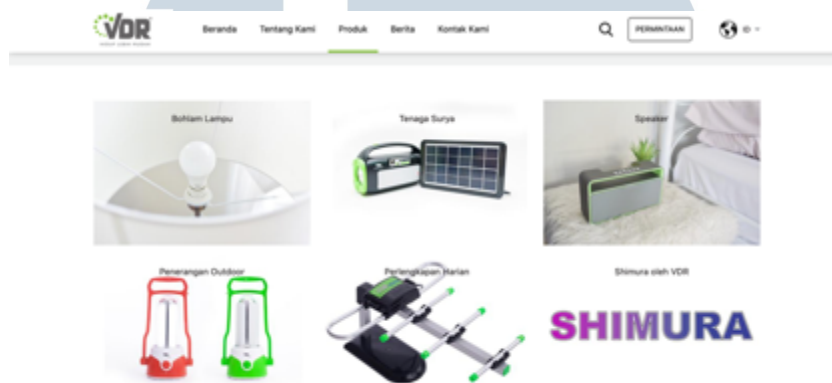
Gambar 2. 2 Website Vedora Indo Cahaya

Dalam upaya memenuhi kebutuhan konsumen yang beragam, PT Vedora Indo Cahaya menghadirkan beberapa merek sebagai bagian dari strategi diferensiasi produk. Produk VDR & Pro Series ditujukan untuk segmen yang membutuhkan produk dengan spesifikasi dan kualitas yang lebih unggul, serta berada pada kategori harga yang lebih tinggi. Sementara itu, produk Maxxis Ekonomis, SHIMURA & VDR ECO dihadirkan untuk menyediakan produk pencahayaan dengan harga yang lebih ekonomis dan terjangkau, sehingga dapat menjangkau lapisan konsumen yang lebih luas.