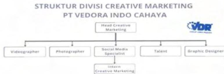
Gambar 2. 5 Struktur Organisasi Divisi Creative Marketing