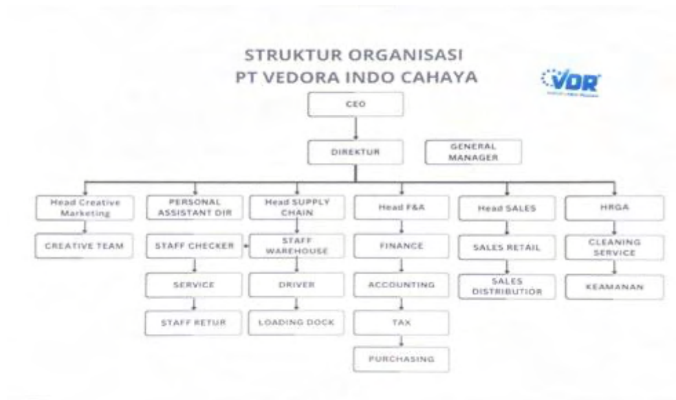
Gambar 2. 4 Struktur Organisasi Perusahaan