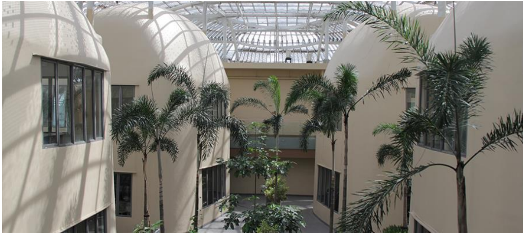
Gambar 2. 2 Fasilitas Inkubator bisnis Skystar Ventures