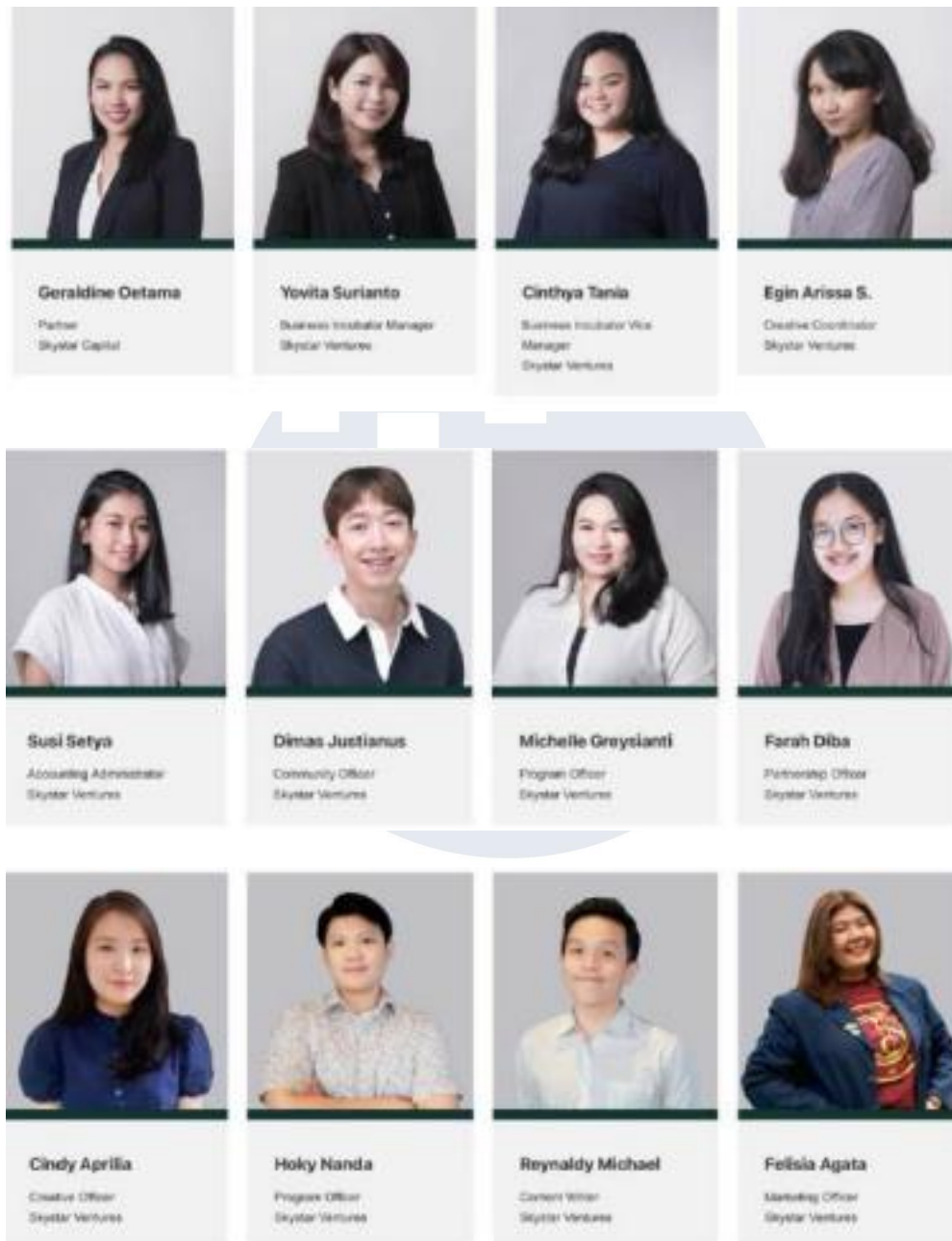
Gambar 2. 3 Tim Manajemen Skystar Ventures