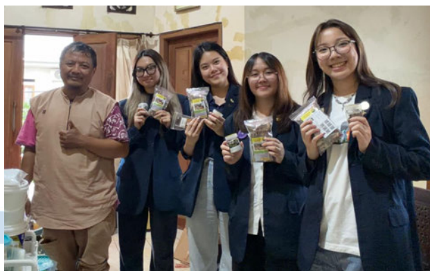
Gambar 2.2 Wawancara dengan pemilik UMKM Dbumbu

Masyarakat di perumahan ini menunjukkan dinamika sosial bersifat kekeluargaan dan informal, dengan banyaknya anak sekolah yang tampak akrab dan bermain dengan tetangganya. Melalui wawancara dengan beberapa warga setempat, banyak dari mereka yang bekerja kantoran di Jakarta karena jarak yang relatif dekat dengan tempat tinggal. Sementara sebagian lain sudah pensiun atau memiliki anggota keluarga yang bekerja atau kuliah di luar kota, sehingga membuka usaha kecil-kecilan seperti warung dan catering untuk menunjang kebutuhan sehari-hari. Dicantumkan juga bahwa terdapat lokasi yang dishakan menjadi Taman Jajanan UMKM Griya Asri Pamulang yang sempat menjadi ramai setelah COVID-19, namun kini sudah tidak dipakai karena kurangnya akses masuk ke perumahan yang membuat penjualan menurun.