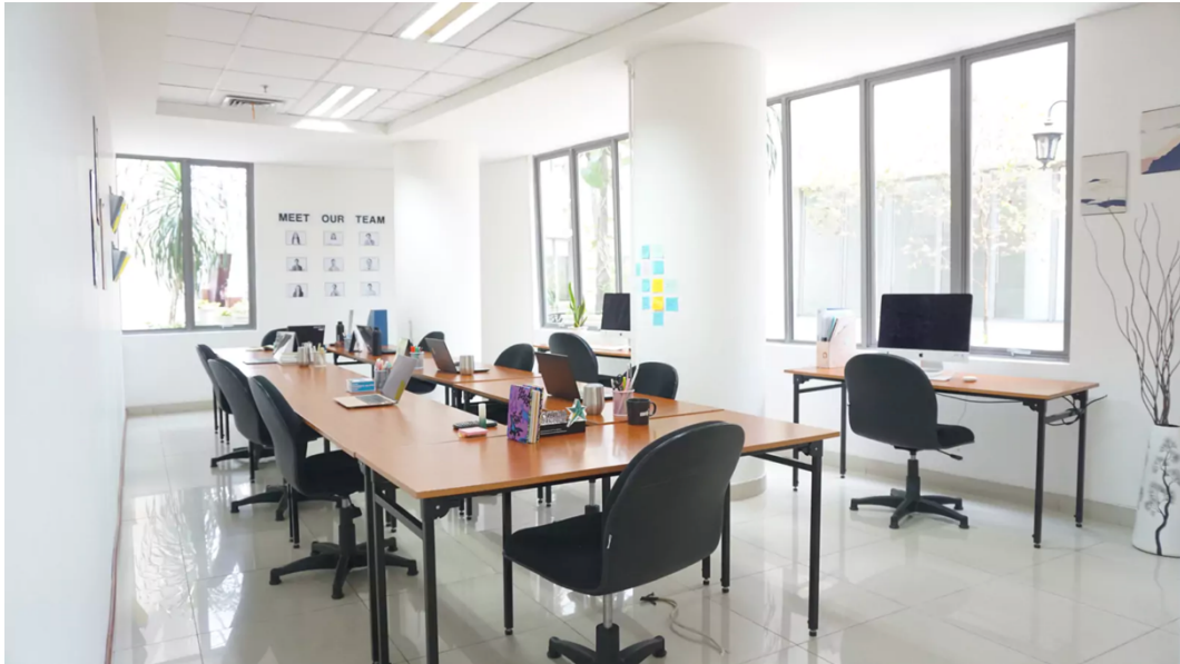
Gambar 2.2. Collaborative Working Space