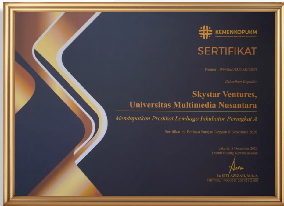
Gambar 2.4. Kegiatan dan Pencapaian Skystar Ventures dalam Mengembangkan Ekosistem Startup