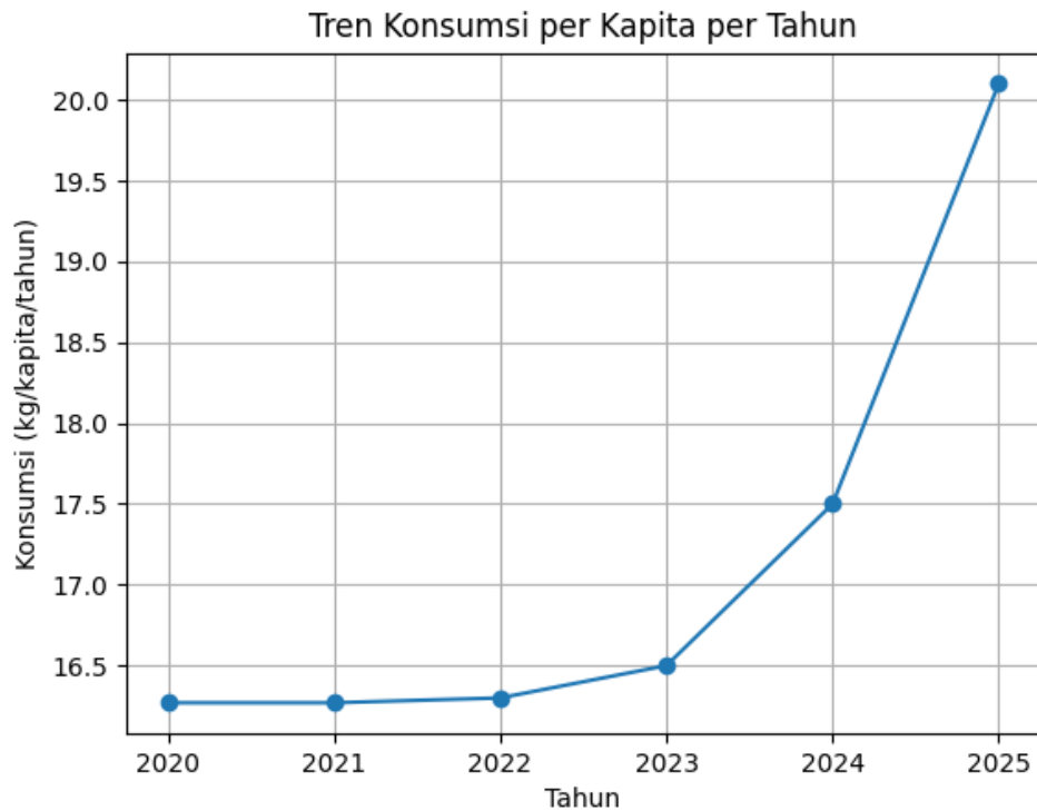
Gambar 1.3 Tren Konsumsi per Kapita per Tahun

yang besar bagi pelaku usaha untuk menghadirkan produk minuman susu dengan konsep yang lebih modern, sehat, dan inovatif.