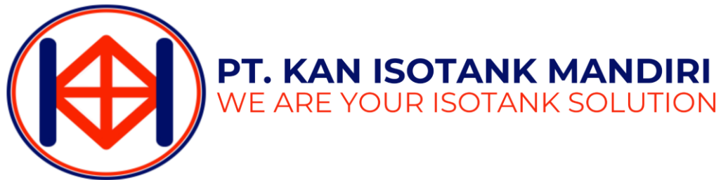
Gambar 2.1 Logo PT Kan Isotank Mandiri