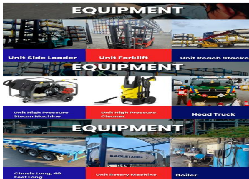
Gambar 2.4 Equipment PT Kan Isotank Mandiri Sumber : PPT Company Profile PT Kan Isotank Mandiri 2026

Selain fasilitas yang memadai, perusahaan ini dilengkapi dengan beberapa peralatan (equipment) yang juga mempunyai banyak fungsi dalam mendukung kegiatan jenis layanan perusahaan, beberapa peralatan (equipment) yang mencakup seperti Side Loader , Forklift , Reach Stacker , mesin jet cuci, Rotary machine , chassis truck , head truck serta boiler machine