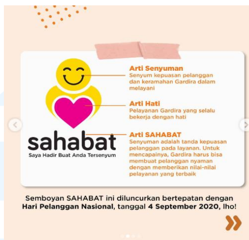
Gambar 2. 7 Logo Sahabat