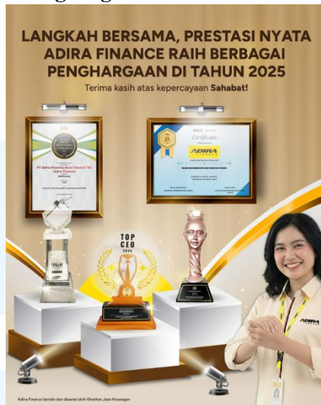
Gambar 2. 4 Penghargaan yang Diraih Adira