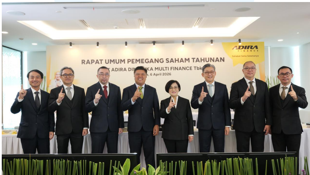
Gambar 2. 5 RUPST Adira 6 April 2026

Bank Danamon Indonesia memiliki porsi saham mayoritas 92,07 persen dari struktur kepemilikan. Ini karena Adira Finance adalah bagian dari MUFG Group, sebuah grup keuangan internasional yang besar. Struktur kepemilikan ini membantu pendanaan, menjaga sinergi bisnis, dan meningkatkan tata kelola perusahaan.