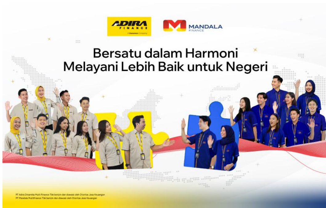
Gambar 2. 8 Merger Adira Finance dengan Mandala Finance