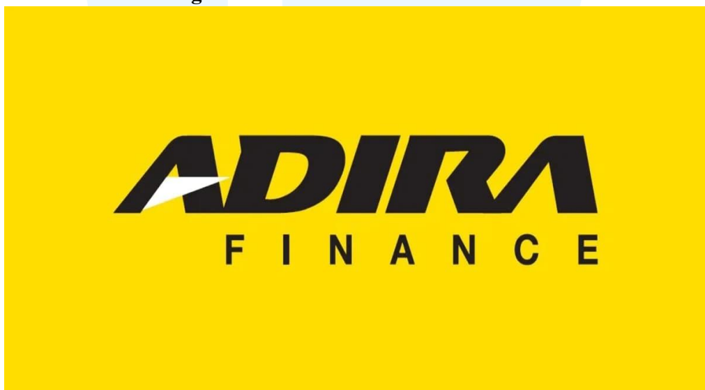
Gambar 2. 6 Logo Adira Finance