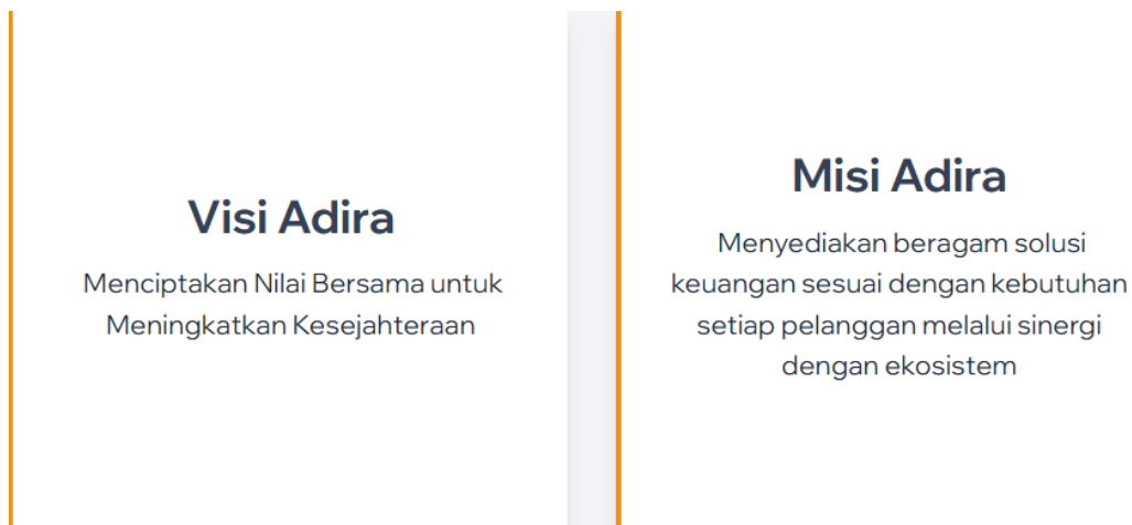
Gambar 2. 2 Visi dan Misi Adira Finance