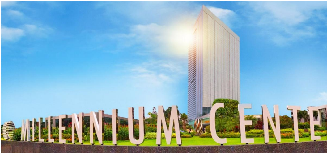
Gambar 2. 1 Lokasi Kantor Pusat Adira Finance