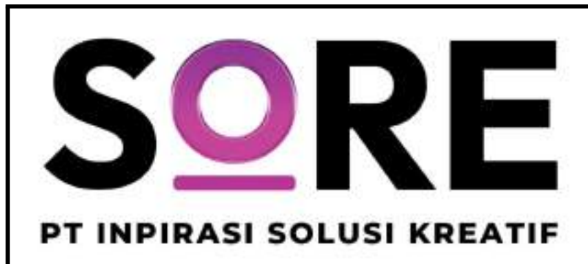
Gambar 2.1.1 : Logo Perusahaan