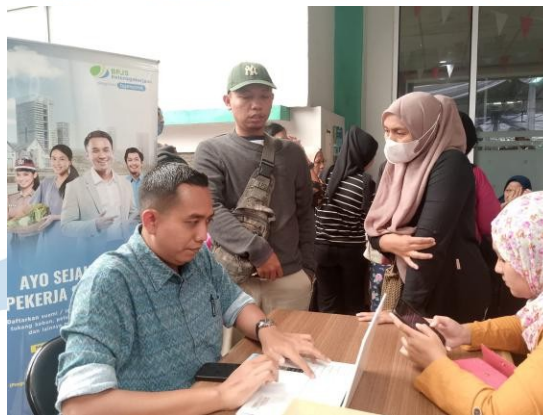
Gambar 2.1 Aktivitas Sosial Masyarakat Kelurahan Pondok Betung.

Masyarakat yang menjadi sasaran dalam proses ini adalah individu yang tinggal di Kelurahan Pondok Betung, kawasan yang berkembang pesat di Tangerang Selatan dengan dominasi sektor perdagangan dan jasa, didukung oleh infrastruktur ekonomi dan fasilitas publik yang relatif lengkap. Berdasarkan data monografi kelurahan, jumlah penduduk Pondok Betung mencapai sekitar 310.955 jiwa dengan 98.924 kepala keluarga, menjadikannya salah satu wilayah dengan kepadatan aktivitas sosial dan ekonomi yang tinggi di Kota Tangerang Selatan. Namun, meskipun Pondok Betung menjadi salah satu wilayah yang relevan, NaS Parfum juga menasar pasar yang lebih luas di Jabodetabek. Dengan kualitas dan nilai budaya yang diusung, produk ini memiliki daya tarik bagi konsumen di berbagai wilayah urban dan semi-urban lainnya, seperti Jakarta, Bogor, Depok, Tangerang, dan Bekasi. Produk NaS Parfum yang mengangkat filosofi lokal serta menggunakan bahan organik telah mendapat respons positif dari masyarakat yang menghargai keberlanjutan dan kesejahteraan pribadi.