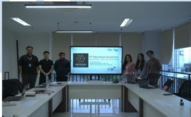
Gambar 2.2 Foto Dokumentasi Wawancara dengan Pemilik NaS Parfum.

Masyarakat memberikan respons positif terhadap produk yang ramah lingkungan, berbahan organik, serta memiliki dampak yang lebih luas bagi diri mereka sendiri dan lingkungan. Produk lokal yang mengangkat nilai budaya Indonesia, seperti NaS Parfum yang menggunakan minyak atsiri lokal, memiliki daya tarik tersendiri karena mampu menghadirkan ketenangan, meredakan stres, sekaligus merepresentasikan identitas budaya Indonesia dalam bentuk yang relevan dengan gaya hidup modern masyarakat perkotaan (NaS., wawancara pribadi, 2025).