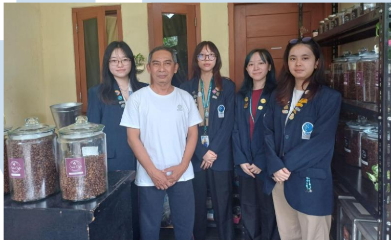
Gambar 2.2 Foto Dokumentasi Community Engagement Siola Coffee

satunya merupakan lembaga resmi LPMK (Lembaga Pemberdayaan Masyarakat Kelurahan). Melalui observasi aktivitas akun Instagram LPMK Kelurahan Medang, lembaga membantu mempromosikan kegiatan penjualan UMKM seperti bazar di area Medang, serta pelatihan atau workshop terkait UMKM. Hal ini didukung dengan informasi yang diperoleh dari wawancara dengan salah satu pelaku UMKM daerah Kelurahan Medang yakni Siola Coffee.