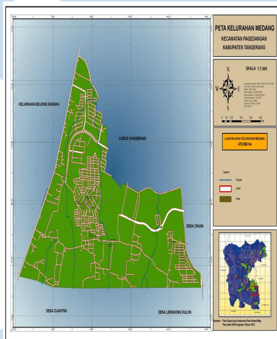
Gambar 2.1 Peta Wilayah Kelurahan Medang

UMKM Siola Coffee berlokasi di Perumahan Medang Lestari, Kelurahan Medang, Kabupaten Tangerang, Banten, Indonesia. Berdasarkan ADMIN Kelurahan Medang (2023), Kelurahan Medang merupakan institusi eksekutif turunan dari pemerintah otonomi Kabupaten Tangerang yang bertugas memberdayakan dan mendorong pembangunan masyarakat. Sebelum menjadi kelurahan, Medang terklasifikasi sebagai desa yang kemudian terbentuk menjadi Kelurahan Medang agar dapat memenuhi kebutuhan masyarakat.