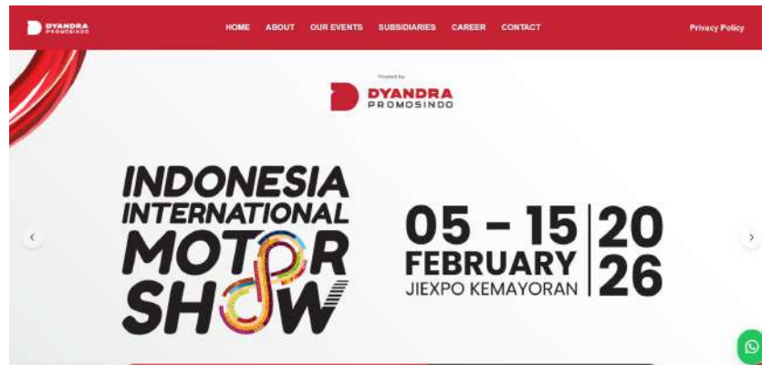
Gambar 2.4 Website PT Dyandra Promosindo

Selama beroperasi, PT Dyandra Promosindo memiliki website resmi yaitu dyandra.com sebagai salah satu saluran informasi yang menyediakan berbagai informasi penting terkait profil perusahaan dan berbagai agenda event yang akan diselenggarakan. Perusahaan juga aktif menggunakan social media untuk memperluas jangkauan publikasi dan berinteraksi dengan audiens, seperti akun instagram @dyandrapromosindo , akun tiktok @dyandra.promosindo channel Youtube @dyandra.promosindo dan @dyandraacademy yang menampilkan konten seputar kegiatan, dokumentasi acara, liputan, dan materi edukatif mengenai wawasan seputar dengan industri MICE. Adapun untuk alamat dari kantor PT Dyandra Promosindo berlokasi di Gedung Dyandra Promosindo, Jalan gelora VII No.15, RT.4/RW.2, Gelora, Kecamatan Tanah Abang, Jakarta Pusat 10270.