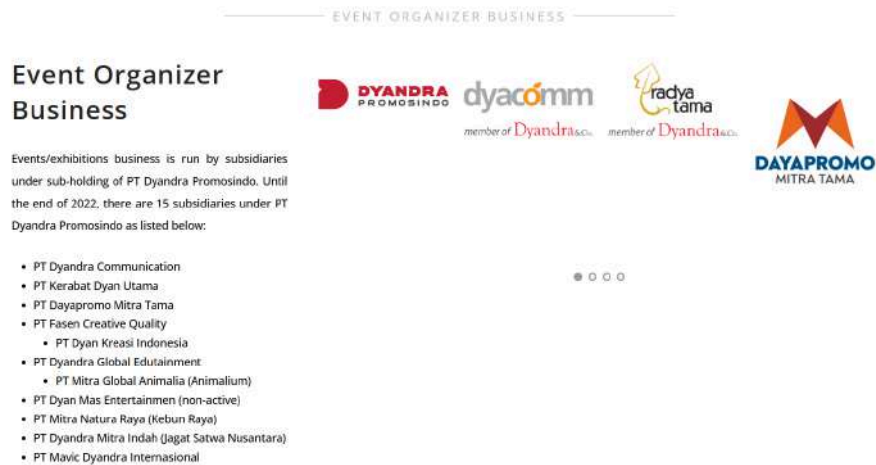
Gambar 2.3 Unit Bisnis PT Dyandra Promosindo

yang lebih kuat dan relevan dalam menghadapi challenge di era baru industri MICE di Indonesia.