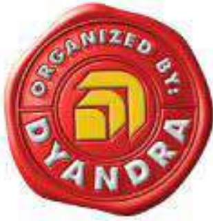
Gambar 2.1 Logo Dyandra Promosindo 2024

Business Concept Expo & Conference (IFRA), Periklindo Electric Vehicle Show (PEVS), Projek-D, Halal Indonesia International Industry Expo (Halal Indo), dan Indonesian Petroleum Association Convention & Exhibition (IPA Convex), serta masih banyak lagi event bergengsi lainnya.