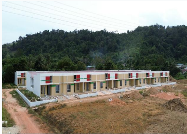
Gambar 2. 2 Proyek Wilayah Tanjung Piayu