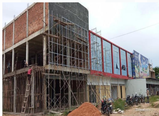
Gambar 2. 4 Proyek Wilayah Batu Aji

Grand Permata Bandara merupakan salah satu proyek properti yang dikembangkan oleh PT Harapan Sriwijaya Perkasa yang berlokasi di kawasan Nongsa. Proyek ini menawarkan berbagai jenis properti seperti rumah hunian, ruko, dan gudang yang dirancang untuk memenuhi kebutuhan tempat tinggal maupun kegiatan usaha masyarakat. Lokasinya yang berada di area strategis menjadikan proyek ini memiliki potensi yang baik sebagai hunian maupun investasi properti di Kota Batam.