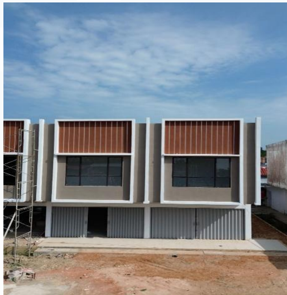
Gambar 2. 5 Proyek Wilayah Tiban

Proyek Grand Nato Residence merupakan salah satu proyek yang dikembangkan oleh PT Harapan Sriwijaya Perkasa yang berlokasi di wilayah Batu Aji, Kota Batam. Proyek ini terdiri dari pembangunan ruko yang dirancang untuk mendukung kegiatan usaha masyarakat di Kawasan batu aji dengan lokasi yang strategis, proyek ini diharapkan dapat menjadi pusat aktivitas bisnis serta memberikan nilai investasi bagi para pemilik unit.