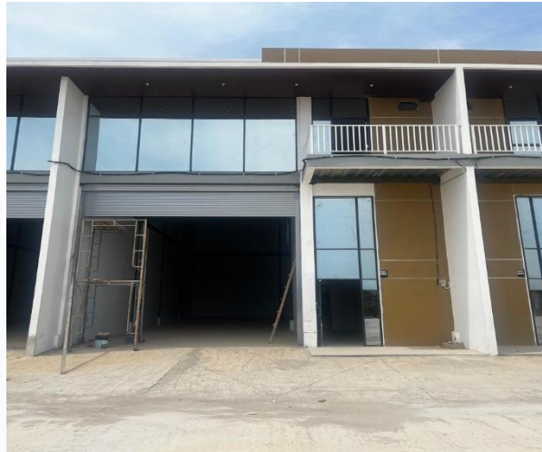
Gambar 2. 3 Proyek Wilayah Nongsa