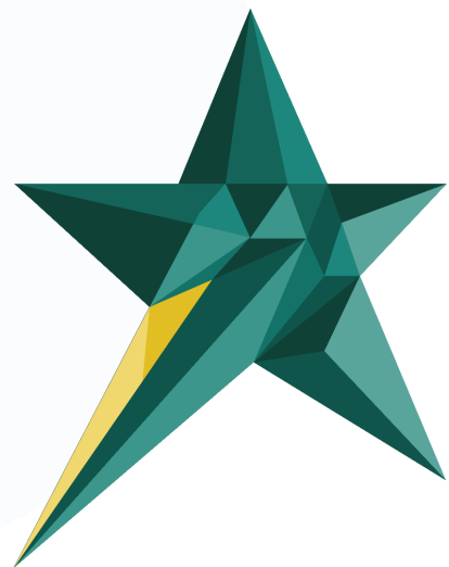
Gambar 2.1 Logo Perusahaan Skystar Ventures

Skystar Ventures merupakan inkubator bisnis dan coworking space yang berada di bawah naungan Universitas Multimedia Nusantara dan didukung oleh Kompas Gramedia Group. Skystar Ventures didirikan untuk mendukung perkembangan startup serta membangun ekosistem kewirausahaan yang inovatif, khususnya bagi mahasiswa dan pelaku usaha tahap awal di Indonesia. Berdasarkan informasi pada website resminya, Skystar Ventures berfokus pada pengembangan startup tahap awal melalui ekosistem terintegrasi yang mendukung proses pertumbuhan bisnis dari tahap ide hingga pengembangan usaha yang lebih matang.