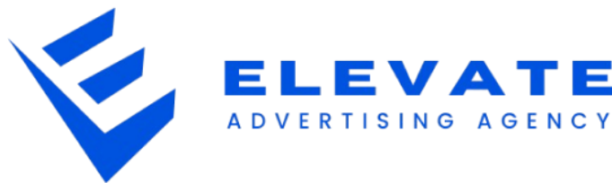
Gambar 2.1 Logo Elevate Advertising Agency

Elevate Advertising Agency merupakan perusahaan yang bergerak di bidang digital marketing yang didirikan pada tahun 2024 dan berlokasi di Jakarta, Indonesia. Perusahaan ini hadir sebagai respons terhadap perkembangan pesat ekosistem digital, khususnya dalam sektor e-commerce dan social media marketing yang semakin kompetitif. Perubahan perilaku konsumen yang beralih ke platform digital mendorong kebutuhan akan strategi pemasaran yang tidak hanya kreatif, tetapi juga berbasis data dan terukur. Sejak awal berdirinya, Elevate Advertising Agency berfokus pada penyediaan layanan digital marketing berbasis performa (performance marketing). Fokus utama perusahaan adalah membantu pelaku usaha, khususnya di sektor e-commerce, dalam meningkatkan penjualan, traffic, serta brand awareness melalui strategi iklan yang terstruktur dan berbasis analisis data.