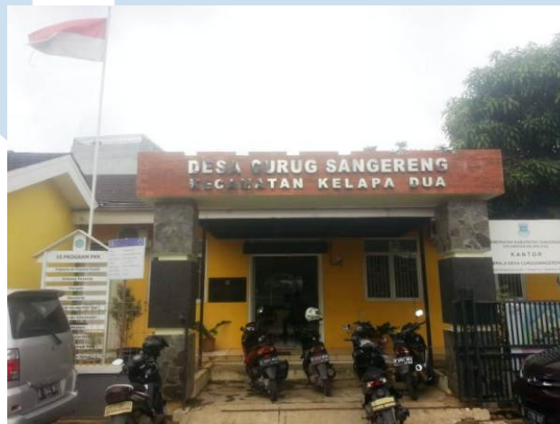
Gambar 2.1 Foto Kantor Desa Curug Sangereng

Desa Curug Sangereng merupakan salah satu wilayah yang berada di Kecamatan Kelapa Dua, Kabupaten Tangerang, Provinsi Banten. Desa ini terbentuk pada tahun 1983 sebagai hasil pemekaran dari Desa Cihuni dan hingga saat ini menjadi satu-satunya desa yang berada di wilayah Kecamatan Kelapa Dua. Secara administratif, Desa Curug Sangereng memiliki luas wilayah sekitar 4,07 km 2 yang terbagi ke dalam beberapa Rukun Warga (RW) dan Rukun Tetangga (RT) yang tersebar di berbagai wilayah permukiman.