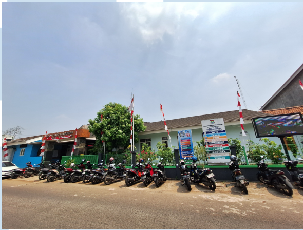
Gambar 2.2 Foto Lingkungan Desa Curug Sangereng

Letak desa yang berada di kawasan yang terus berkembang dan berdekatan dengan wilayah perkotaan menjadikan pola kehidupan masyarakat bersifat dinamis. Selain penduduk asli, terdapat pula masyarakat pendatang yang menetap dan bekerja di sekitar wilayah desa.