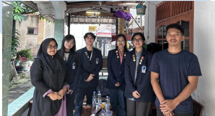
Gambar 2.1 Foto Dokumentasi Community Engagement

2.1 Masyarakat sasaran kegiatan PROSTEP penulis adalah Pondok Cabe Ilir, Pamulang, Tangerang Selatan. Berdasarkan data dari dukcapil 2024, penduduk Pondok Cabe Ilir, Pamulang terdapat sekitar 37.949 jiwa (data Disdukcapil Tangsel 2024), dengan komposisi 19.015 jiwa laki-laki dan 18.934 jiwa perempuan. Mata pencaharian penduduk Desa Pondok Cabe Ilir didominasi oleh karyawan swasta, ibu rumah tangga dan wiraswasta, tetapi tercatat sebanyak 8.174 jiwa yang belum/tidak bekerja.