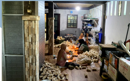
Gambar 2.1 Foto Dokumentasi Pabrik UMKM Kerupuk RHR Snack

Desa Bakti Jaya adalah kawasan yang berkembang cukup cepat dengan fasilitas pelayanan publik yang tersedia di tingkat kelurahan. Karakteristik warga di wilayah tersebut memiliki interaksi sosial yang cukup aktif. Kegiatan warga kerap melibatkan kegiatan kemasyarakatan yang rutin dilaksanakan.