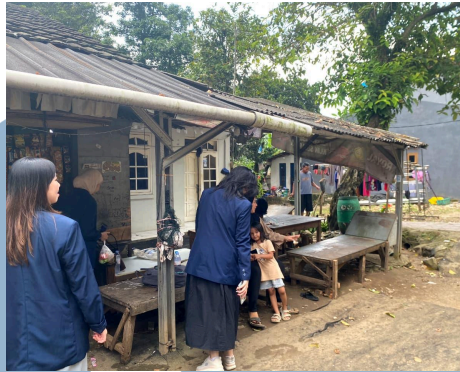
Gambar 2.2 Foto Dokumentasi Halaman Rumah Pemilik UMKM Sayur 2 Putri