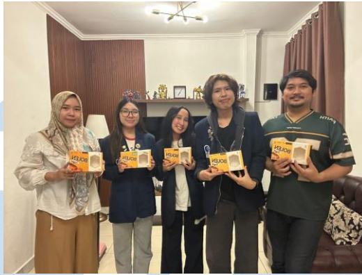
Gambar 2.2 Foto Dokumentasi UMKM KueQue

Berikut merupakan gambar yang menampilkan proses observasi penulis dengan kelompok ke salah satu UMKM di Desa Sangereng yaitu UMKM KueQue. Kegiatan observasi ini dilakukan secara langsung di lokasi usaha dengan tujuan untuk memperoleh informasi yang lebih mendalam mengenai kondisi usaha, proses produksi, serta aktivitas operasional yang berlangsung di dalam UMKM tersebut.