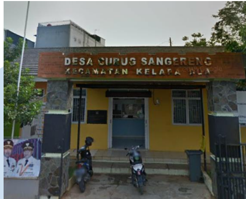
Gambar 2.1 Foto Dokumentasi Desa Curug Sangereng

Visi Desa Curug Sangereng adalah menjadi desa yang modern dan memiliki sistem administrasi yang baik dengan tetap menjunjung tinggi nilai-nilai kekeluargaan, gotong royong, harmoni, serta interaksi sosial yang positif di tengah masyarakat. Dalam mewujudkan visi tersebut, Desa Curug Sangereng berupaya menciptakan lingkungan yang nyaman, bersih, serta menghadirkan suasana kebersamaan yang hangat dan bersahabat bagi seluruh masyarakat yang tinggal di dalamnya. Dalam upaya mendukung tercapainya visi tersebut, desa ini memiliki beberapa misi yang berfokus pada peningkatan kualitas pelayanan dan fasilitas bagi masyarakat.