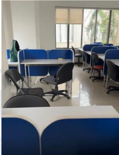
Gambar 2. 2 Coworking space Skystar Ventures

fasilitas, bimbingan, serta jaringan yang relevan bagi pelaku usaha dalam mengembangkan bisnisnya.