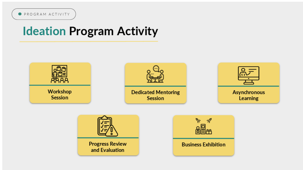
Gambar 2. 5 Ideation Program Activity

Canvas), Branding & Marketing, Usability Testing, dan How to Pitch. Rangkaian materi tersebut bertujuan untuk membantu peserta memahami proses pengembangan bisnis mulai dari identifikasi masalah, validasi solusi, penyusunan model bisnis, hingga strategi pemasaran dan penyampaian ide bisnis kepada calon investor maupun konsumen.