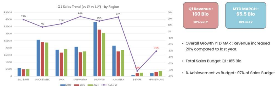
Gambar 2.4 Ikhtisar Kinerja Bisnis PT Everbesindo Surya Jaya Kuartal Pertama Tahun 2026