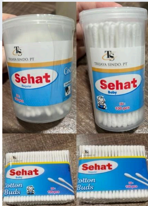
Gambar 2. 2 Produk cotton buds "sehat"

Gambar diatas merupakan cotton buds “Sehat” yang merupakan merk pertama dari PT. Trijaya Sindo yang di produksi sendiri dan juga diperjual belikan dengan merk label sendiri. Dimana produknya ada yang cotton buds pod varian regular dan juga baby , dan juga ada yang cotton buds refill varian