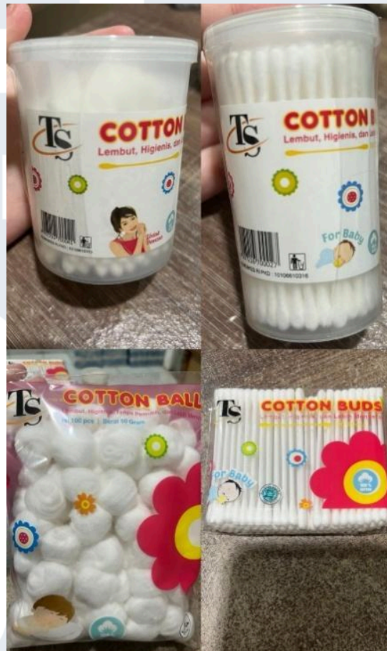
Gambar 2. 3 Produk cotton buds & cotton ball "TS"

Gambar diatas merupakan cotton buds & cotton ball “TS” yang merupakan merk kedua dari PT. Trijaya Sindo yang di produksi sendiri dan juga diperjual belikan dengan merk label sendiri. Namun pada gambar yang saya tampilkan ada satu cotton buds regular yang tidak ada pada gambar karena ketidak tersediaan stok pada saat itu. Pada umumnya sama dengan yang ada diatas yaitu produk “Sehat” hanya terdapat tambahan satu produk