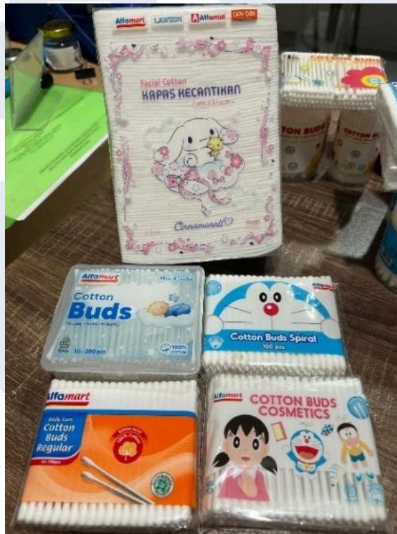
Gambar 2. 4 Produk cotton buds & facial cotton private label "alfa group"

Gambar diatas merupakan cotton buds & facial cotton dari private label yaitu Alfa Group yang dimana didistribusikan langsung kepada Alfa Group dan dijual di Alfa Group, seperti Alfamart, Lawson, Alfamidi, dan juga Dan-Dan. Untuk produknya ada facial cotton yang memiliki 1 jenis, selain itu juga ada cotton buds untuk baby , cotton buds spiral , cotton buds cosmetics , dan juga cotton buds regular . Perbedaan antara jenis cotton buds yang ada adalah terletak pada bagian kegunaannya, jika cotton buds baby itu lebih tipis dan kecil, sedangkan cotton buds spiral terlihat dari bentuknya berbeda untuk membantu mengangkat kotoran menjadi lebih optimal dibanding cotton buds biasa, sedangkan cotton buds cosmetics memiliki perbedaan dibagian ujungnya yaitu lebih runcing tujuannya adalah untuk membersihkan sisa-sisa