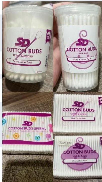
Gambar 2. 5 Produk cotton buds private label "SD"

Gambar diatas merupakan cotton buds dari private label yaitu SD, yang didistribusikannya melalui merk private label tersebut. Untuk jenisnya ada cotton buds pod dewasa dan bayi, cotton buds refill dewasa dan bayi, dan juga ada cotton buds spiral .