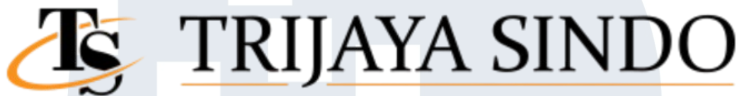
Gambar 2. 1 Logo perusahaan PT. Trijaya Sindo