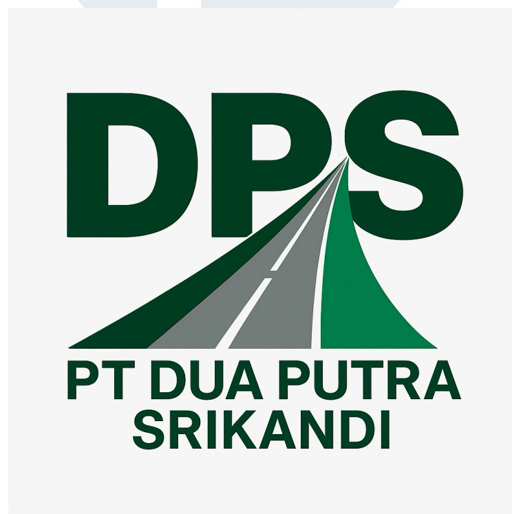
Gambar 2.1 Logo PT Dua Putra Srikandi

Logo PT Dua Putra Srikandi menggambarkan identitas perusahaan dalam bidang infrastruktur dan perlengkapan jalan. Bentuk visual pada logo perusahaan menyerupai jalan raya dengan garis di bagian tengah, dimana itu mencerminkan fokus perusahaan dalam pekerjaan marka jalan, konstruksi jalan, serta perlengkapan jalan. Desain tersebut juga memberikan kesan arah, perkembangan, dalam menjalankan kegiatan usaha perusahaan.