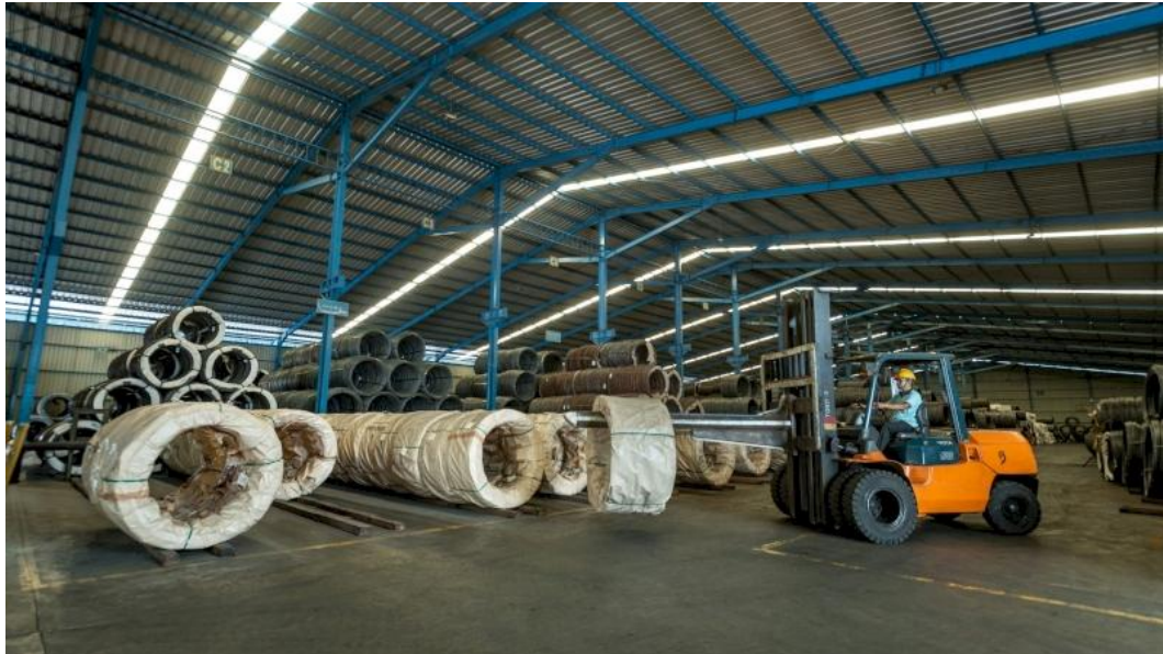
Gambar 2.2 Warehouse PT MegaPratama Ferindo