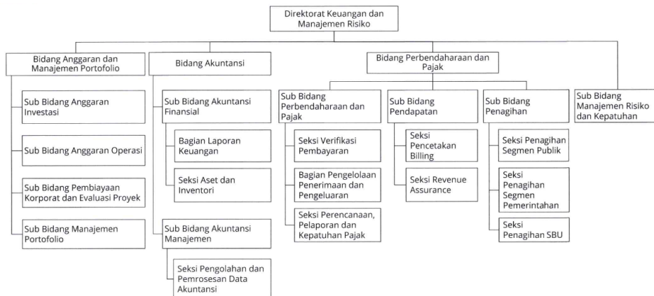
Gambar 2.3 Bagan Struktur Organisasi Perusahaan