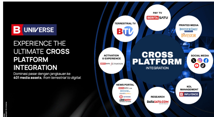
Gambar 2. 2 B-UNIVERSE Media Holdings