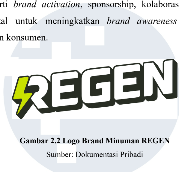
Gambar 2.2 Logo Brand Minuman REGEN

Dalam upaya memperluas jangkauan pasar, PT Global Enak Nikmat menerapkan strategi pemasaran yang memanfaatkan kanal digital maupun jaringan distribusi modern. Produk REGEN telah dipasarkan melalui berbagai platform digital dan ritel modern sehingga dapat menjangkau konsumen secara lebih luas. Di samping itu, perusahaan aktif menjalankan berbagai kegiatan pemasaran seperti brand activation , sponsorship, kolaborasi komunitas, serta kampanye digital untuk meningkatkan brand awareness dan memperkuat hubungan dengan konsumen.