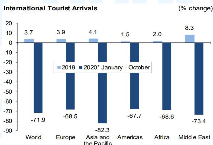
Gambar 1. 1 Grafik kedatangan turis internasional

Pariwisata adalah sebuah aktivitas yang dilakukan oleh individu dengan tujuan mengunjungi sebuah tempat yang memiliki lokasi berbeda dari tempat tinggal atau tempat asal individu tersebut, sering kali pariwisata dilakukan untuk aktivitas seperti liburan, rekreasi, kepentingan bisnis atau kepentingan pendidikan (Sekolah Tinggi Pariwisata Ambarrukmo Yogyakarta, 2024). Pariwisata merupakan salah satu aspek paling penting dalam perkembangan ekonomi dunia yang dapat mendukung perkembangan bisnis dunia serta membawa dampak positif kepada keuangan berbagai negara dengan kontribusi pendapatan yang dihasilkan oleh pariwisata, dapat dibuktikan dari kontribusi yang dihasilkan oleh pariwisata terhadap PDB nasional pada tahun 2023 sebesar 4,67% (Kementerian Pariwisata, 2026) dan 4,01% pada 2024 (Kementerian Koordinator Bidang Perekonomian RI, 2025). Pada skala global, pariwisata berkontribusi sebesar 9,8% kepada PDB global dan membawa pulang sebesar US$ 11.6 triliun (World Travel & Tourism Council, 2025). Tetapi pada saat pandemi pariwisata tidak memiliki statistik yang tinggi seperti tahun-tahun sekarang.