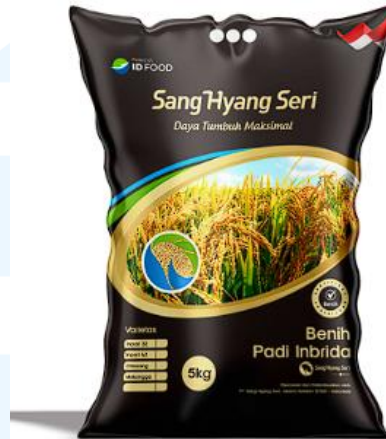
Gambar 2 5 Gambar Benih Padi Varian Hitam