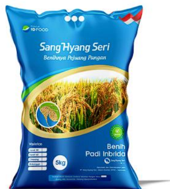
Gambar 2 3 Gambar Benih Padi Varian Biru