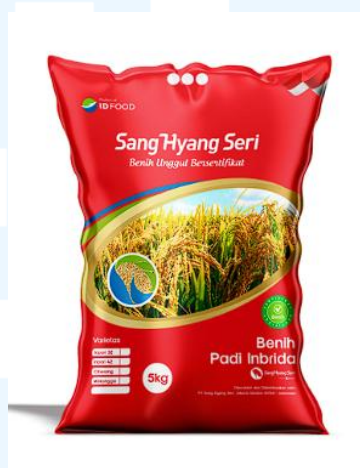
Gambar 2.4 Gambar Benih Padi Varian Merah