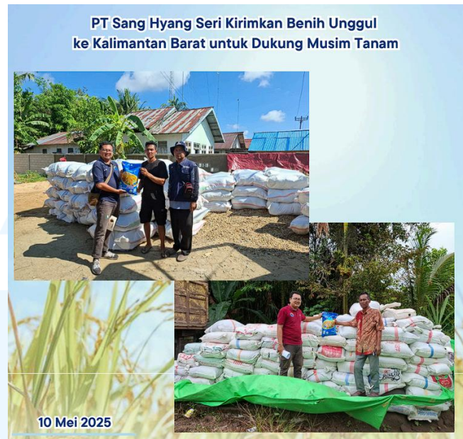
Gambar 2 7 Gambar Kegiatan Distribusi Benih PT Sang Hyang Seri