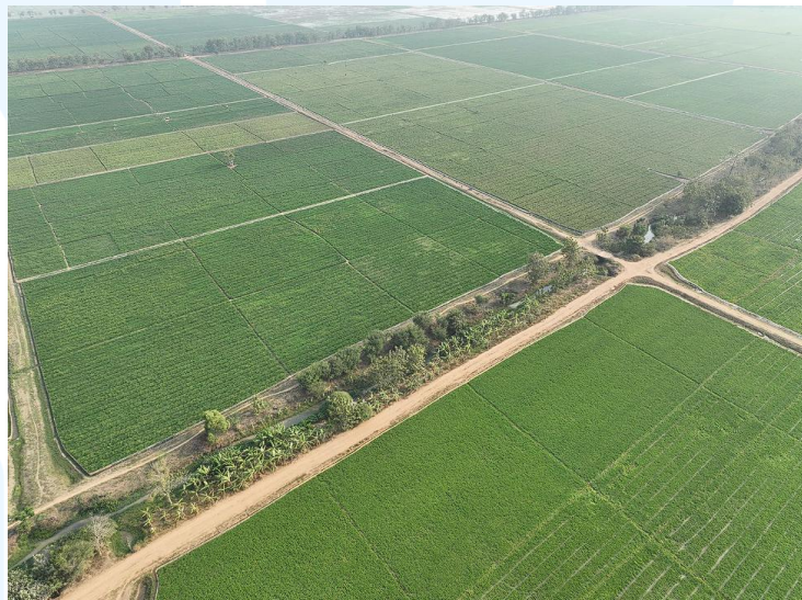
Gambar 2 2 Gambar Lahan Produksi Sukamandi PT Sang Hyang Seri

Latar belakang berdirinya PT Sang Hyang seri berdasarkan pada saat pemerintah Indonesia sedang gencar menjalankan program Revolusi Hijau pada tahun 1960-1970, hal tersebut dilakukan karena pada saat itu sedang mendorong produksi pangan. Dalam program tersebut, dibutuhkan pasokan benih unggul bersertifikat dalam jumlah yang besar. Namun belum adanya lembaga yang dapat mengelola sektor perbenihan secara khusus di tingkat nasional sehingga dibentuklah Sang Hyang Seri.