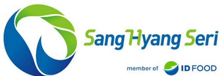
Gambar 2 1 Gambar Logo PT Sang Hyang Seri