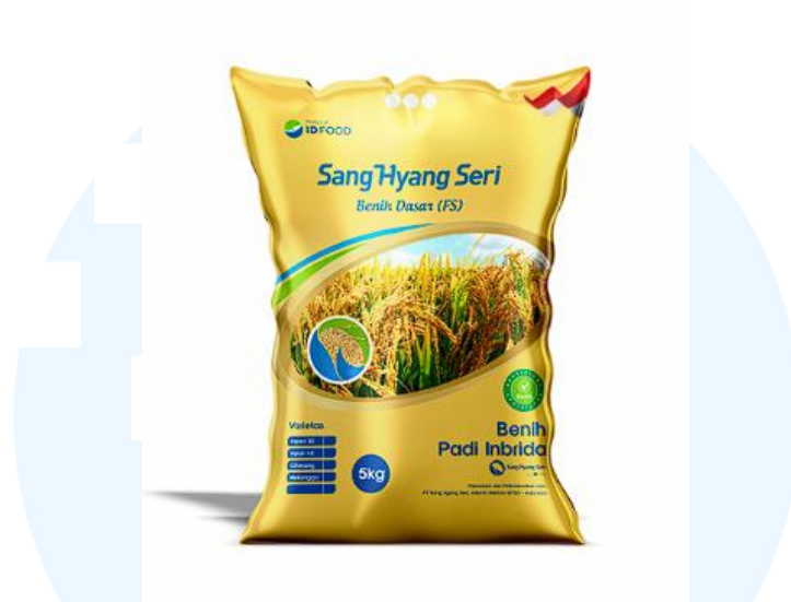
Gambar 2 6 Gambar Benih Padi Varian Gold