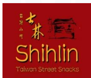
Gambar 2.2 Logo Shihlin Taiwan Street Snacks