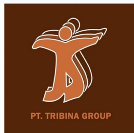
Gambar 2.1 Logo Perusahaan Tribina Group