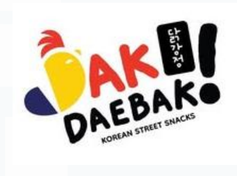
Gambar 2.3 Logo DakDaebak

DakDaebak merupakan merek Korean Street Snacks yang diluncurkan Tribina Group untuk menjawab tingginya antusiasme masyarakat Indonesia terhadap kuliner Korea. Gerai pertamanya resmi dibuka pada Desember 2025 di Supermal Karawaci, Tangerang. Mengusung konsep Korean street-style yang vibrant dan autentik dengan kolaborasi Chef Korea Narae Hahn. DakDaebak menawarkan berbagai jajanan khas Korea seperti Dakgangjeong, Dakkochi, Tteokbokki, dan Hotteok, dengan konsep unik Pay What You Want berdasarkan berat produk per 100 gram.