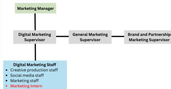
Gambar 2.6 Struktur Divisi Marketing Pada Tribina Group

Penulis ditempatkan di divisi Marketing selama program magang. Tribina Group: Setiap brand dalam Tribina Group juga memiliki departemen Marketing sendiri yang bertugas merancang dan melaksanakan strategi pemasaran sesuai dengan karakteristik serta target pasar masing-masing produk. Berikut adalah ruang lingkup kerja divisi Marketing Tribina Group: