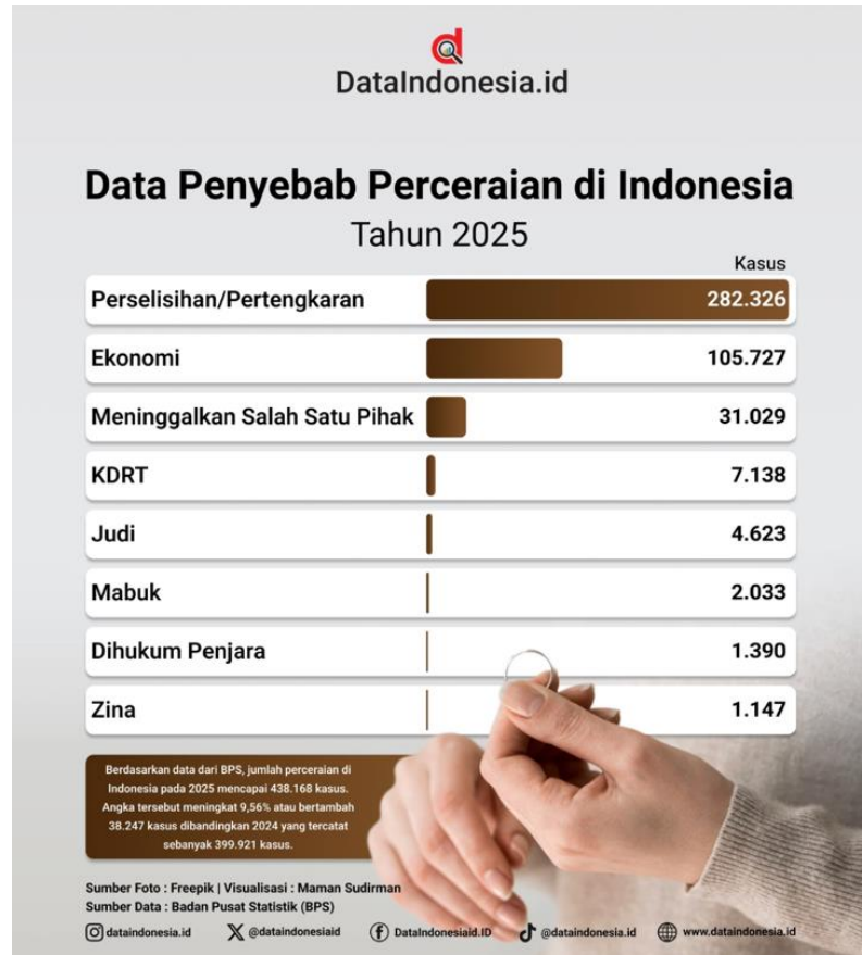
Gambar 1.1 Alasan Pasangan Bercerai