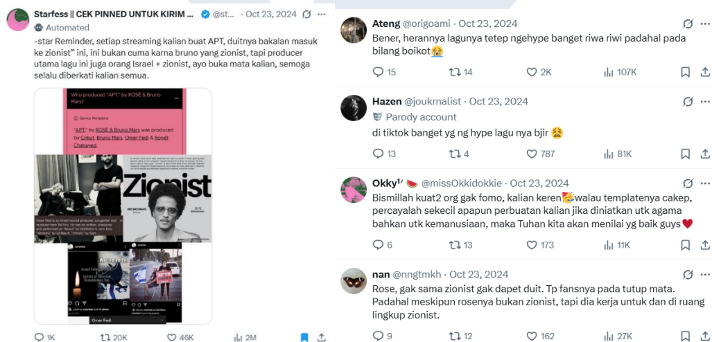
Gambar 1.6 Interaksi di akun X @starfess

Akun X @starfess beroperasi sebagai autobase dengan sistem kiriman confess , artinya konten (teks/gambar/video) dikirim oleh pengikutnya secara anonim, lalu dipublikasikan oleh admin secara otomatis melalui bot. Sistem ini memungkinkan @starfess menjadi tempat fans untuk mengemukakan pendapat secara anonim dan terbuka. Akun ini mendorong aktivitas diskusi yang tinggi, termasuk isu boikot dan zionisme, yang terlihat dari banyaknya unggahan fess, reply, serta interaksi pengguna. Berdasarkan penelitian yang dilakukan oleh Putri (2024), @starfess merupakan akun yang aktif dalam melakukan interaksi dengan topik pembahasan ‘boikot’ dibanding akun autobase lainnya di media sosial X. Sifat yang terbuka dan jangkauan audiensnya yang luas membuat @starfess sering digunakan sebagai ruang untuk melihat dinamika opini fandom K-Pop Indonesia terhadap berbagai isu, termasuk keterlibatan artis dengan isu zionisme. Dengan demikian, akun ini menjadi tempat yang ideal untuk meneliti paparan konten media sosial dan niat boikot para penggemar K-Pop di Indonesia.