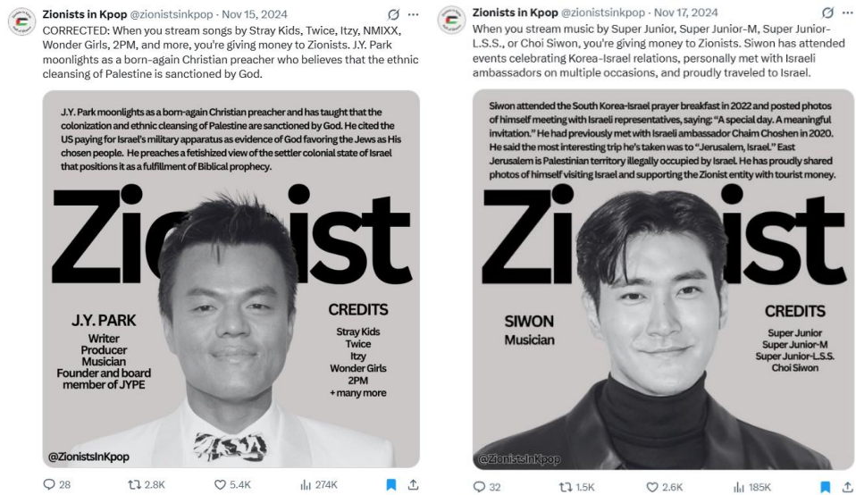
Gambar 1.3 Unggahan Akun X @zionistsinkpop

Sementara itu, akun @starfess di platform X dikenal sebagai salah satu autobase fandom terbesar di Indonesia. Akun yang hanya beroperasi di X ini bergabung sejak Desember 2019 dan telah mencapai 1,028,801 per 10 November 2026. Pemilihan penggunaan platform X juga mendukung perkembangan akun serta relevansi penelitian ini, karena karakteristiknya mendukung diskusi real-time , anonimitas, serta penyebaran opini melalui repost dan reply . Oleh karena itu, akun X @starfess menjadi wadah bagi penggemar musik, terutama penggemar K-Pop, untuk menyalurkan opini, curahan hati, hingga diskusi seputar isu-isu yang berkembang di dunia hiburan. Akun ini bersifat all-fandom , artinya tidak terfokus hanya pada satu artis tertentu, tetapi seluruh artis dalam ranah musik Korea Selatan (K-Pop).