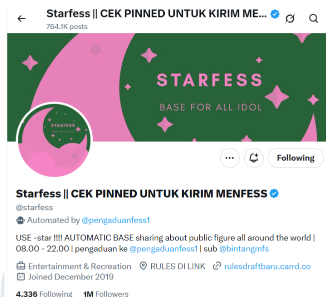
Gambar 1.4 Akun X @starfess

Melalui penggunaan social listening tool Tweet Binder , peneliti menemukan bahwa unggahan di akun @starfess yang menggunakan kata kunci ‘kpop’ meraup 92,733 total impressions dalam satu minggu. Tingginya jumlah impressions tersebut menunjukkan diskusi terkait K-Pop di akun @starfess memiliki jangkauan dan tingkat eksposur yang besar di kalangan pengikutnya. Hal ini menunjukkan @starfess sebagai salah satu autobase terbesar untuk pembahasan seputar K-Pop di kalangan penggemarnya.