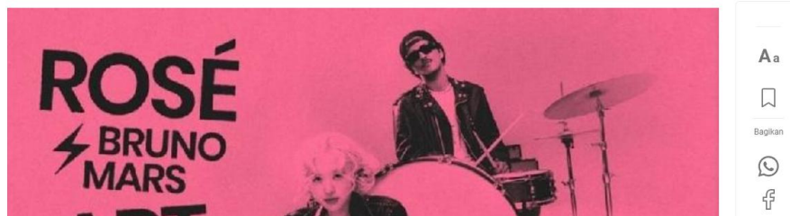
Gambar 1.2 Artikel Kesuksesan 'APT.' oleh ROSE dan Bruno Mars Sumber: Jasmine (2025)

Dalam konteks isu Palestina dan Israel, media sosial menjadi ruang penting untuk penyebaran informasi dan diskursus di kalangan penggemar K-Pop. Berbagai bentuk konten beredar, mulai dari penyampaian informasi hingga upaya ajakan boikot terhadap artis yang diduga terafiliasi dengan pihak pro-Israel. Konten-konten ini diproduksi oleh berbagai akun pribadi hingga kreator, sehingga menciptakan arus informasi yang repetitif dan meningkatkan tingkat paparan ( exposure ) pengguna terhadap pesan boikot di media sosial.