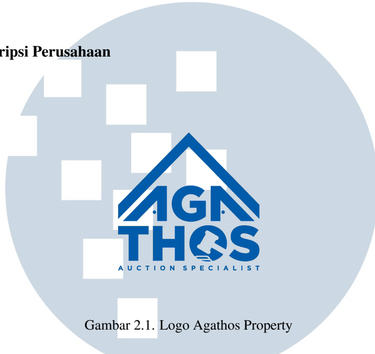
Gambar 2.1. Logo Agathos Property

Gambar 2.1 merupakan logo dari AGATHOS Properti Agency. PT Mitra Properti Forte adalah sebuah perusahaan agensi properti berpengalaman yang khusus bergerak di bidang properti, lelang, secondary, dan primary yang disebut agensi AGATHOS. Agathos didirikan sebagai badan hukum Perseroan Terbatas (PT) pada tahun 2022. Dengan agen-agen yang sudah berpengalaman lebih dari 10 tahun dalam bidang properti, Agathos membentuk pengalaman yang mendalam dalam kategori properti yang menyangkut kebutuhan klien dan riset pasar.