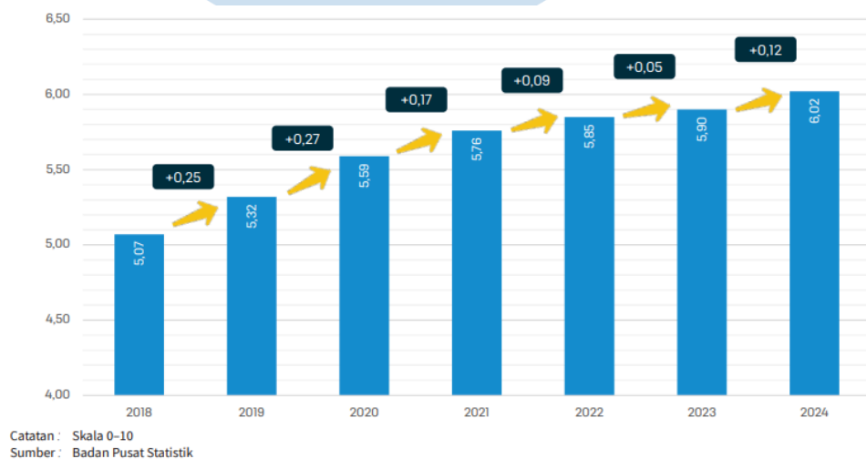
Gambar 1.1 Perkembangan Indeks Pembangunan TIK Indonesia

Era digitalisasi mendorong setiap sektor industri untuk bertransformasi secara digital melalui program Infrastruktur Digital Inklusif, yang akan mendukung ekosistem startup sebagai penggerak ekonomi baru (Kementerian Komunikasi dan Digital RI, 2026). Menurut Badan Pusat Statistik (2025), transformasi digital Indonesia menunjukkan capaian pemanfaatan teknologi informasi & komunikasi yang seimbang dan berkelanjutan. Hal ini dapat membentuk kebijakan yang mendorong dan memperkuat para sektor industri untuk lebih konsisten dalam meningkatkan pemanfaatan teknologi digital dengan lebih optimal (Maharani et al., 2025).