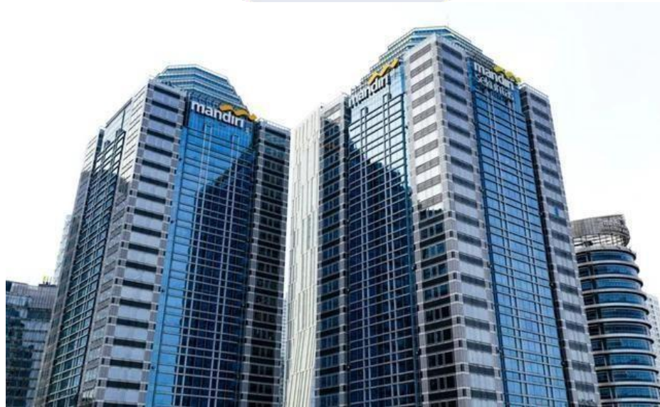
Gambar 2. 1 Menara Mandiri I & II

PT Bank Mandiri (Persero) Tbk merupakan salah satu lembaga perbankan terbesar di Indonesia yang bergerak di bidang jasa keuangan dan perbankan. Bank Mandiri didirikan pada tahun 1998 sebagai bagian dari program restrukturisasi sektor perbankan yang dilakukan oleh pemerintah Indonesia setelah terjadinya krisis ekonomi pada tahun 1997–1998. Pembentukan Bank Mandiri merupakan hasil penggabungan dari empat bank milik pemerintah, yaitu Bank Bumi Daya, Bank Dagang Negara, Bank Ekspor Impor Indonesia (Bank Exim), dan Bank Pembangunan Indonesia (Bapindo). Melalui proses penggabungan tersebut, Bank Mandiri kemudian berkembang menjadi salah satu institusi perbankan terbesar yang memiliki peran penting dalam mendukung pertumbuhan ekonomi nasional (Bank Mandiri, 2023).