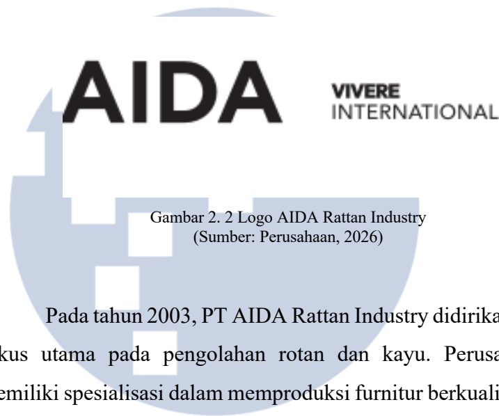
Gambar 2. 2 Logo AIDA Rattan Industry

Pada tahun 2003, PT AIDA Rattan Industry didirikan dengan fokus utama pada pengolahan rotan dan kayu. Perusahaan ini memiliki spesialisasi dalam memproduksi furnitur berkualitas tinggi yang dipasarkan ke pelanggan internasional di seluruh dunia. Di tahun 2016, VIVERE Group mengakuisisi PT AIDA Rattan Industry dan mengembangkan produk dan memperluas pasarnya dibawah unit bisnis VIVERE International . Produk yang ditawarkan sangat beragam, mulai dari furnitur taman, furnitur untuk ruang keluarga seperti meja kopi, kursi, sofa, hingga furnitur kamar makan, kamar tidur, lemari pakaian, spa, aksesoris, dan berbagai kebutuhan interior lainnya. Dalam menjalankan kegiatan operasionalnya, perusahaan menerapkan standar kualitas internasional yang ditunjukkan melalui berbagai sertifikasi dan kepatuhan terhadap regulasi global, seperti standar ASTM, sertifikasi legalitas kayu ( Wood Legal Certification ), serta berbagai audit, seperti Social Compliance Audit , C-TPAT Audit, serta kepatuhan terhadap Consumer Product Safety Improvement Act (CPSIA) dan TSCA. Sertifikasi tersebut berperan penting dalam mempermudah proses perdagangan internasional ke berbagai negara