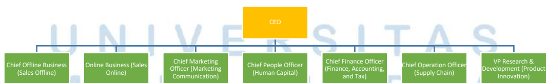
Gambar 2.1 Struktur Organisasi PT Penta Natural Kosmetindo (NPURE)

PT Penta Natural Kosmetindo (NPURE) sebagai perusahaan yang bergerak di bidang kecantikan dan perawatan kulit menjalankan kegiatan bisnis yang meliputi pengembangan produk, produksi, distribusi, penjualan, pemasaran, dan sebagainya. Dalam mendukung operasional perusahaan yang terstruktur dan profesional, PT Penta Natural Kosmetindo (NPURE) memiliki struktur organisasi yang terdiri dari beberapa divisi utama yang saling terintegrasi dalam menjalankan fungsi manajerial dan operasional perusahaan, yaitu sebagai berikut: